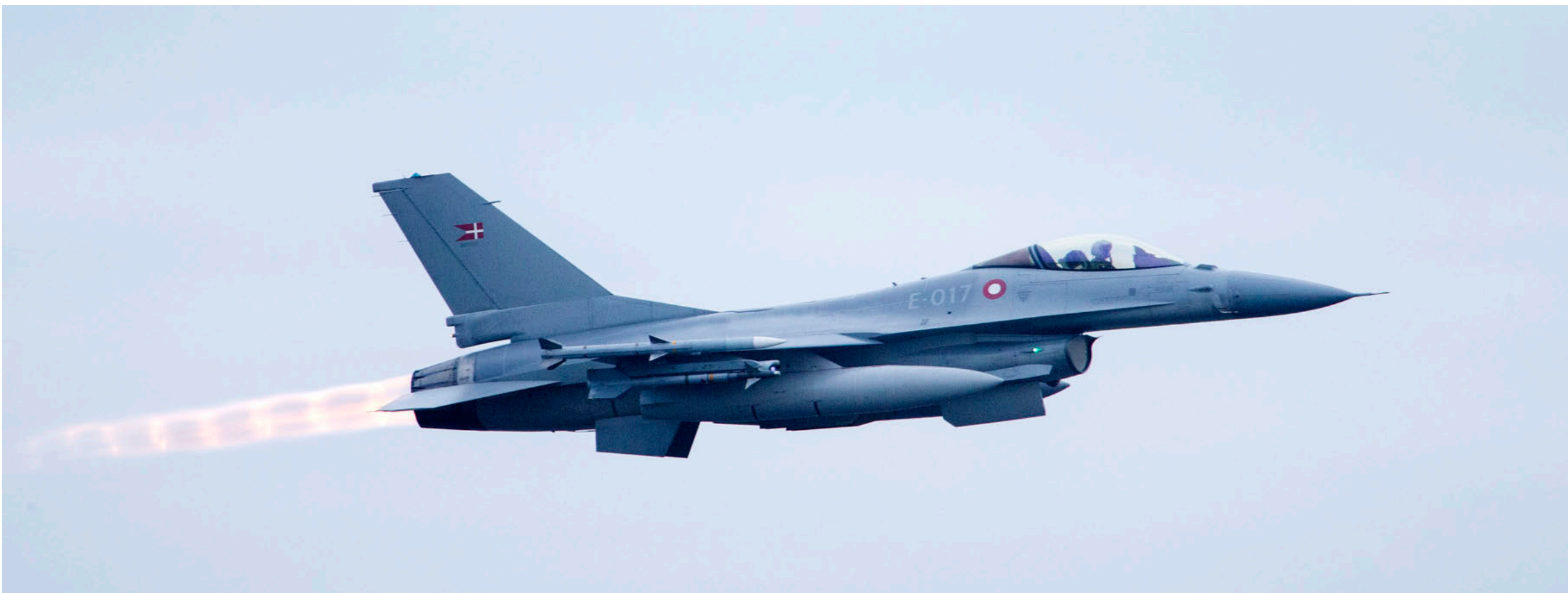
KRIG. Fra 1990 til udgangen af juni 2018 deltog det danske forsvar i 76 militære operationer i regi af FN, Nato, OSCE og internationale koalitioner, hvilket svarer til cirka seks gange så mange operationer som under den kolde krig.